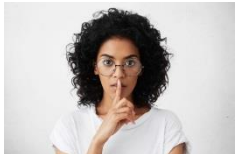
Bild 3: _____